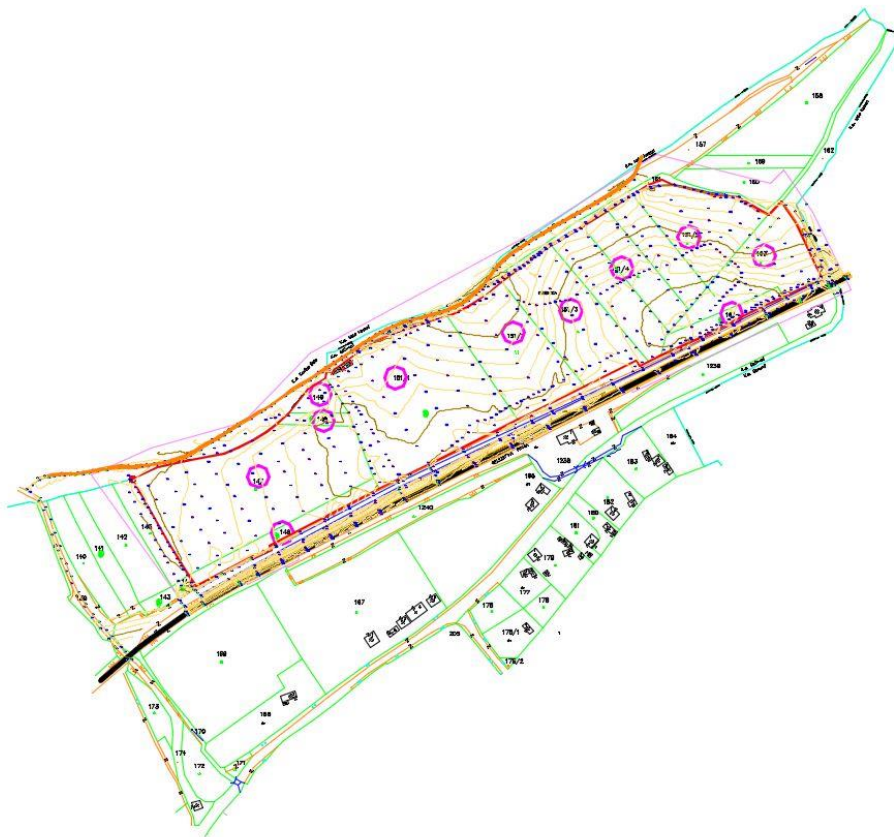
Граница на проектн опфат со приказ на поширока локација

Површината која ја опфаќа опишаната граница изнесува 8,6 ha . Проектната документација треба да се изработи во размер M=1:1000